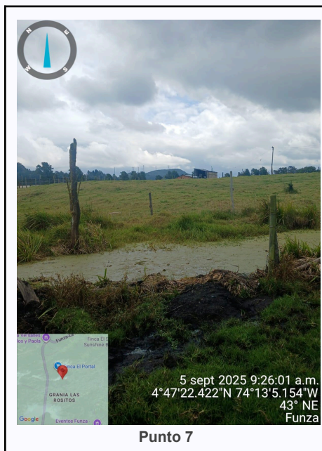
Ilustración 2. Fotos de los puntos del Recorrido de Control Y Vigilancia Ronda Del Humedal Gualí.