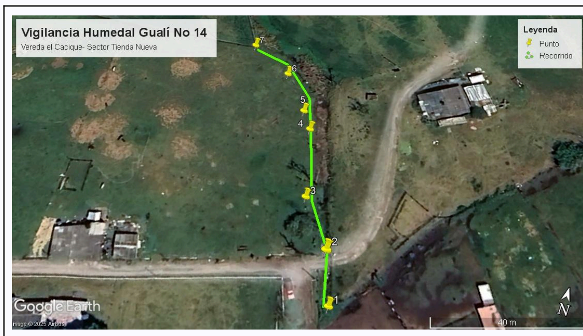
Ilustración 1. Recorrido De Control Y vigilancia Ronda Del Humedal Gualí N°14

Con base en lo anterior, el día 05 de Septiembre se realizó recorrido de control y vigilancia en el humedal Gualí desde las coordenadas 4°47'19.83"N y 74°13'3.576"O hasta las coordenadas 4°47'22.422"N y 74°13'5.154"O (ver ilustración 1. Ruta verde) vereda El Cacique, ecosistema que fue declarado por la Corporación Autónoma Regional de Cundinamarca - CAR como Distrito Regional de Manejo Integrado a través del acuerdo 001 de 2014 "Por medio del cual se declaran como Distrito Regional de Manejo Integrado (DMI), los terrenos comprendidos por los humedales de Gualí, Tres Esquinas y Lagunas de Funzhé, y su área de influencia directa ubicada en los municipios de Funza, Mosquera y Tenjo, Cundinamarca", y estableció tres zonas: 1. Preservación (espejo de agua), 2. Recuperación (50 metros) y 3. Uso sostenible (100 metros)